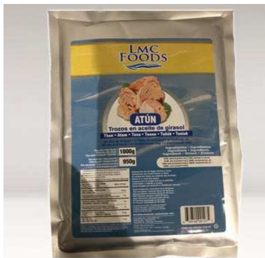
TA3HV1000 Thon Morceaux, Huile Végétale (Poche) 1Kg 16 60