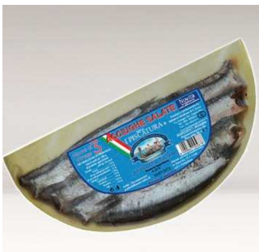
IPIS2ANCS0080 K Anchois au Sel sous vide 8009867005878 80g 20 90