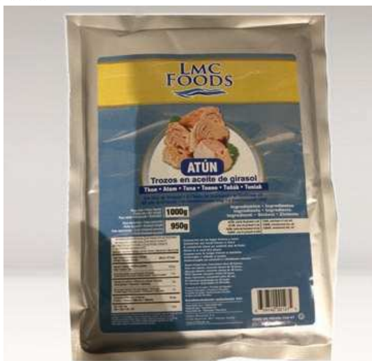
TA3KHV1000 KP Thon Morceaux, Huile Végétale (Poche) 1Kg 16 70