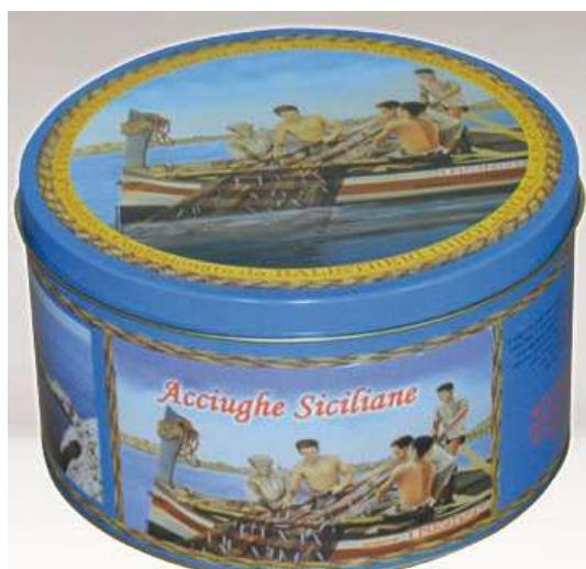
IPIS2ANCS5000 Anchois au Sel 2 Barres 5Kg 4 60